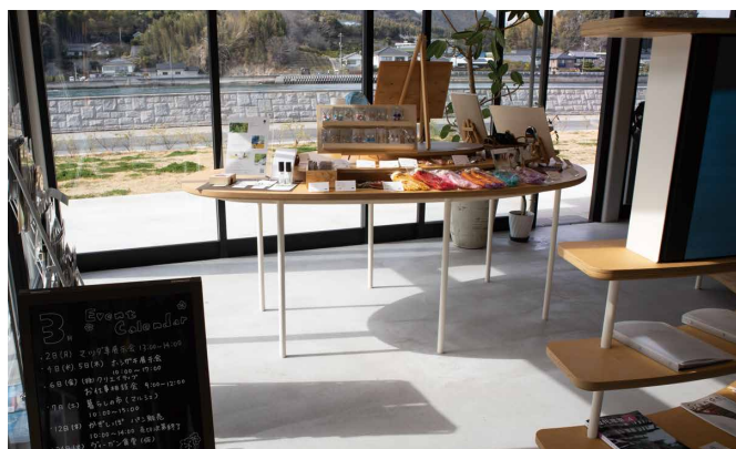
ポナプール楽生苑の交流スペースにあるアンテナショップ

ダイキンエアテクノとお付き合いが始まって以降、空調機を含め、さまざまな設備について気軽に相談できる関係を築いてきました。いつでもお互い連絡できる信頼関係は