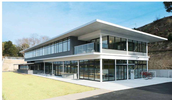
ボナプール楽生苑

1998年の設立以来、広島県、愛媛県、東京都を中心に高齢者・障害者・児童分野を対象とした特別養護老人ホーム、ケアハウス、デイサービスなどの福祉サービス事業を展開しています。本部所在地であり、新生福祉会の施設が14ある生口島は瀬戸内海に浮かぶ穏やかな島で、レモンなどの