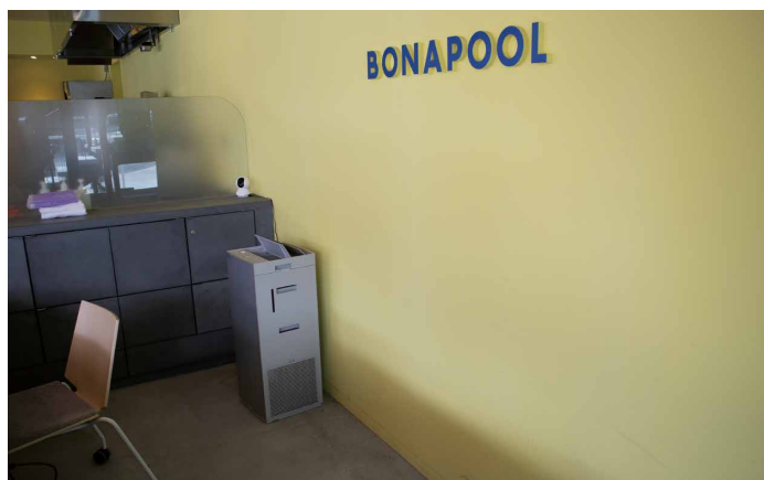
ポナプール楽生苑の交流スペース（左）とバックヤード（右）に設置したUV加湿ストリーマ空気清浄機

本当にかけがえのないもので、DOONに関してもしっかりと話し合うことができました。